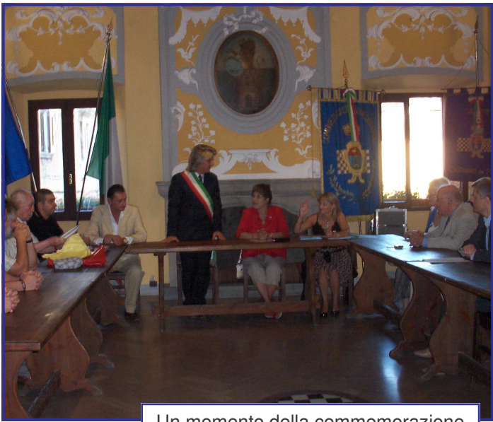
Un momento della commemorazione

La Giunta comunale al fine di ricordare il sacrificio di quei soldati ha deciso di intitolare il nuovo tratto della strada provinciale del Capoluogo (collegante la SP 8 con al SP 325) alla VI a Divisione Corazzata Sudafricana.