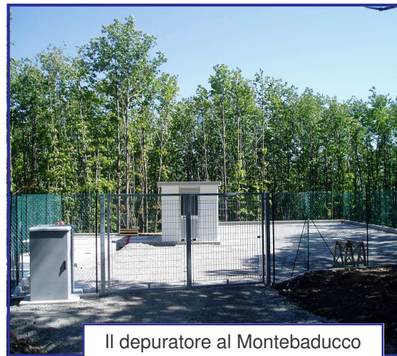
Il depuratore al Montebaducco