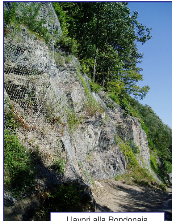
I lavori alla Rondonaia