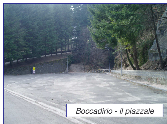
Boccadirio - il piazzale

Sono in corso di ultimazione i lavori per la sistemazione del piazzale sottostante il Santuario di Boccadirio (che è sede anche del mercato stagionale). Detti lavori hanno comportato una spesa pari a circa 100.000 Euro .