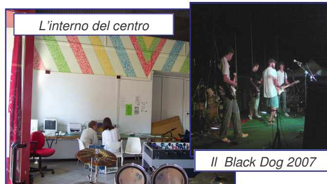
L'interno del centro

antonelliluca@comune.castiglionepepoli.bo.it