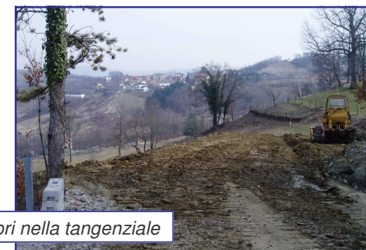
I lavori nella tangenziale

Sono partiti i lavori relativi al secondo tratto della tangenziale a valle del capoluogo (che parte dal centro sportivo San Giovanni con arrivo alla Torricina). I lavori sono eseguiti da privati sulla base di un programma integrato di intervento concordato con l'Amministrazione Comunale.