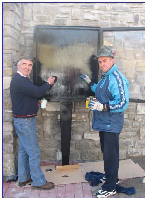
Gli Alpini impegnati in lavori di volontariato a Lagaro.

Il "Gruppo Alpini Valsetta Lagaro" è stato fondato nel 1970 ad opera di pochi alpini. Nel tempo il gruppo è aumentato ed oggi vanta 56 soci e 9 aggregati. L'attività principale è quella del volontariato sotto diverse forme: ad esempio raccogliendo una somma di denaro e portandola ad un amico alpino che aveva perso la casa nell'alluvione di Pontebba, oppure in collaborazione con il Comune di Castiglione dei Pepoli per attività sul territorio e per lavori eseguiti nel paese di Lagaro.