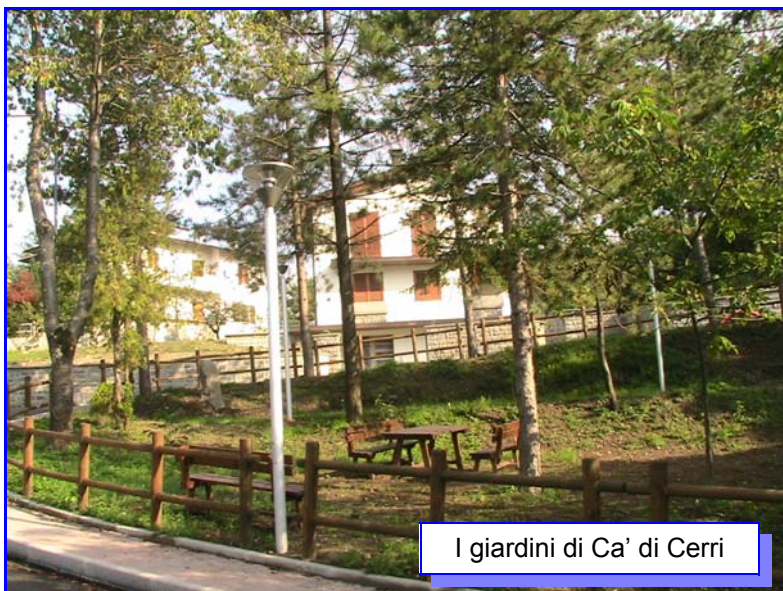
I giardini di Ca' di Cerri