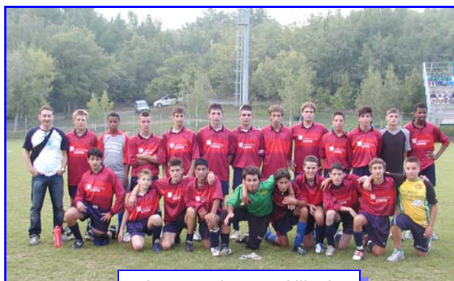
La squadra cat. Allievi

Tutta questa attività comporta un notevole dispendio di forza, energia e .... soldi; ed è grazie ai contributi del comuni di Castiglione e Camugnano che riusciamo a portare avanti i nostri impegni che sono principalmente quelli di tenere assieme ed impegnati tanti ragazzi appartenenti anche a culture diverse offrendo loro interessi, passioni ed un folto gruppo di amici.