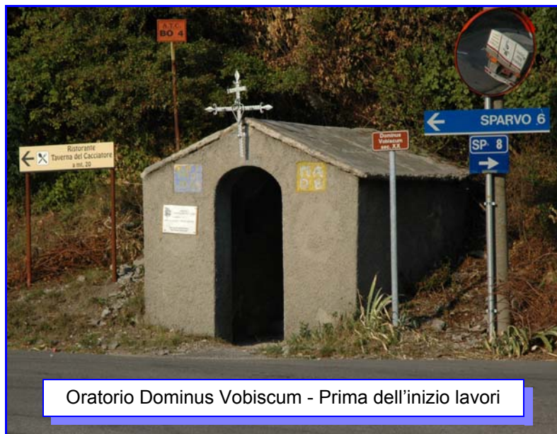
Oratorio Dominus Vobiscum - Prima dell'inizio lavori