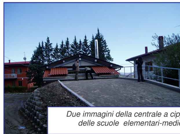
Due immagini della centrale a cippato delle scuole elementari-medie

Infine ricordiamo come le nuove normative sul risparmio energetico impongano l'aggiornamento del Regolamento Edilizio che, nei prossimi mesi, sarà quindi adeguato alle novità in materia.