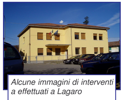
Alcune immagini di interventi a effettuati a Lagaro