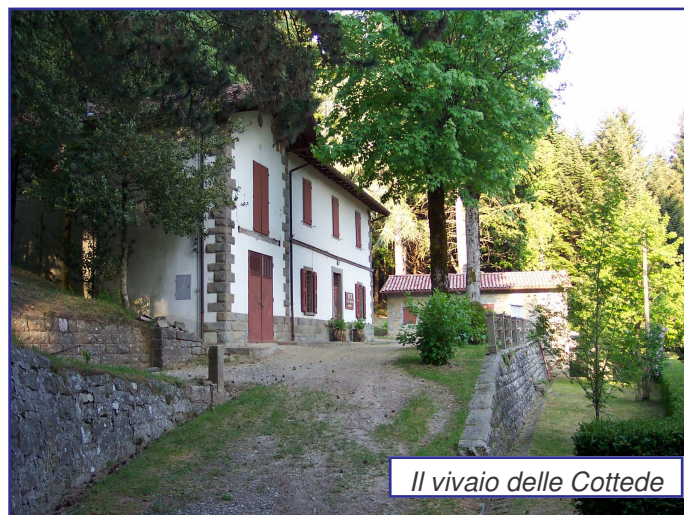
Il vivaio delle Cottede

L'Amministrazione Comunale augura a tutti i cittadini un buon Natale ed un felice 2009