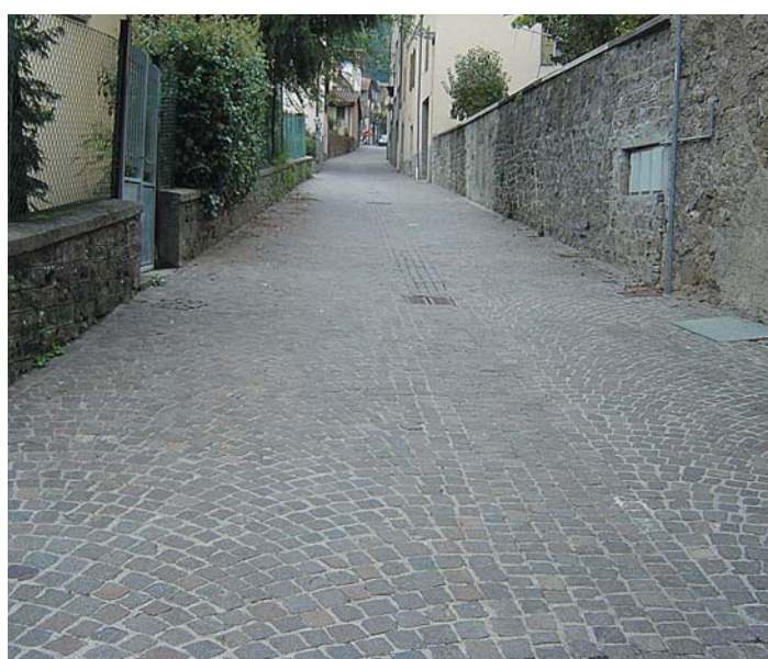
Capoluogo Rifacimento via Cola Montano Progetto e Direzione Lavori Ufficio Tecnico Comunale 1998