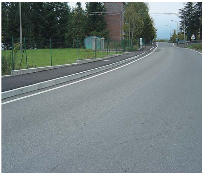
Capoluogo Marciapiede viale Dante Alighieri Progetto e Direzione Lavori Ufficio Tecnico Comunale Geom. Boschi Ufficio Viabilità Provincia 2002