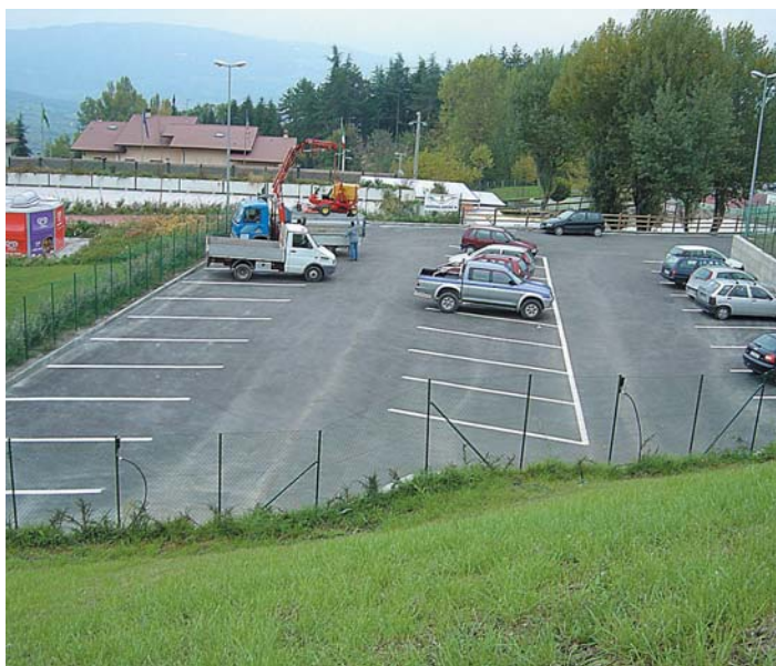
Capoluogo Parcheggio piscina comunale Progetto Direzioni Lavori Ufficio Tecnico Comunale 2003