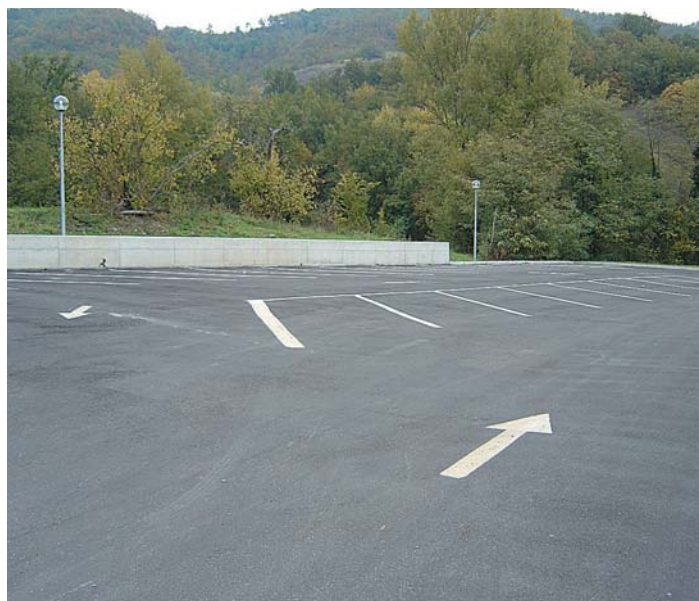
Capoluogo Parcheggio calcetto Progetto e Direzione Lavori Ufficio Tecnico Comunale 2002