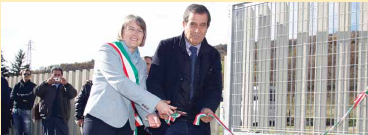
Il 12 novembre è stata inaugurata la nuova Sottostazione Elettrica di Conversione sulla linea ferroviaria Bologna-Pistoia in località Carbona