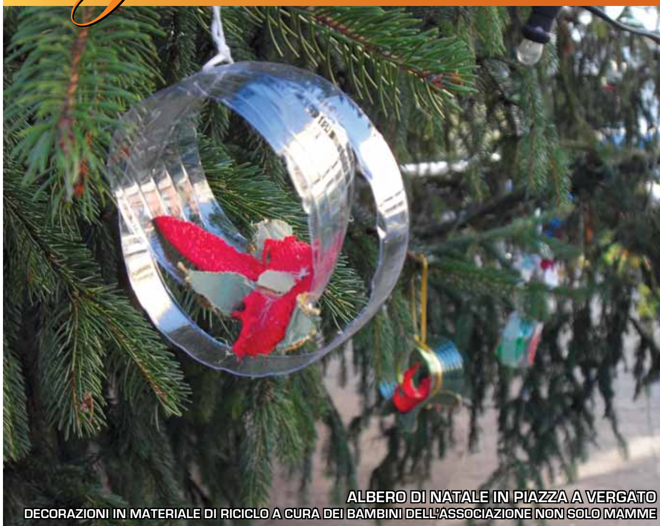
ALBERO DI NATALE IN PIAZZA A VERGATO DECORAZIONI IN MATERIALE DI RICICLO A CURA DEI BAMBINI DELL'ASSOCIAZIONE NON SOLO MAMME

Per la vostra pubblicità contattate: EVENTI soc. coop. - Bologna Tel. 051.6340480 Fax 051.6342192 e-mail: eventi@eventibologna.com www.eventibologna.com