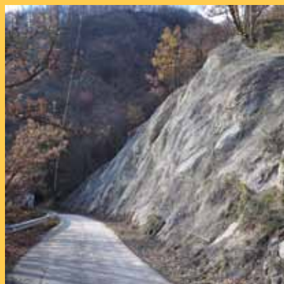
Lavori terminati: Liserna