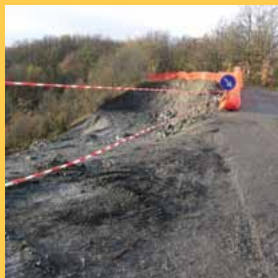
Lavori in corso: Castelnuovo Ruspiano